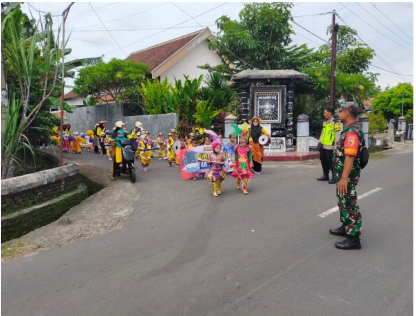
Gebyar Rojabiyah RA dan MI, Babinsa bersama Bhabinkamtibmas Amankan Jalannya Kegiatan Parade Drum Band