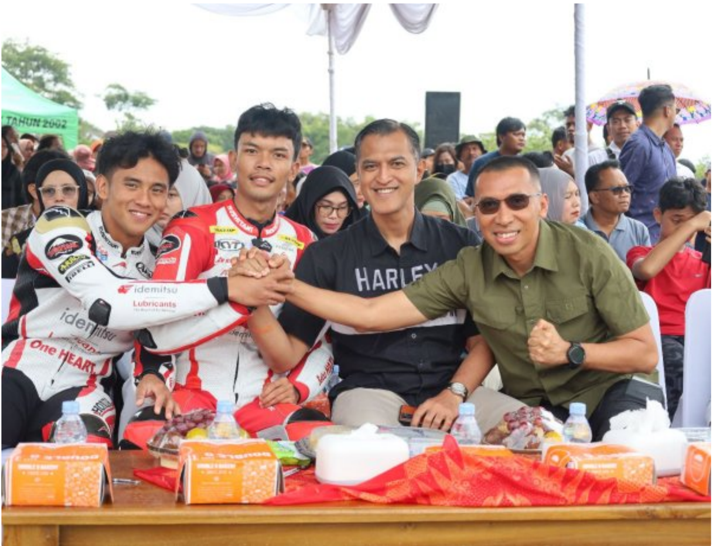
Dandim 0804/Magetan Hadiri Undangan Tinjau Sirkuit Magetan